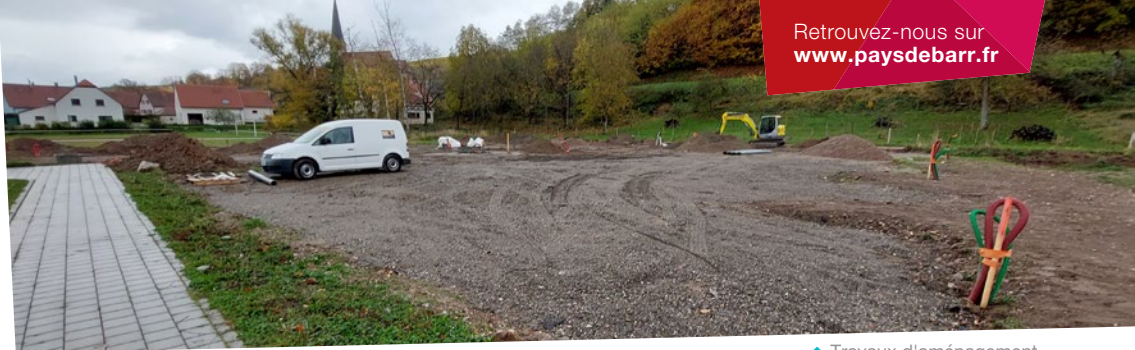
↑ Travaux d'aménagement de l'aire de camping-cars Andlau

Les Grandes Orientations du Projet de Territoire