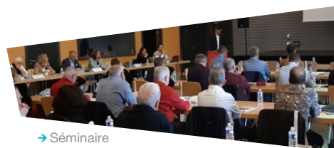
→ Séminaire du 16/10/2021

Un séminaire réunissant l'ensemble des conseillers communautaires, le 16 octobre 2021, a permis de présenter l'ensemble des axes du Projet de Territoire. Ce dernier a été approuvé en Conseil de Communauté le 26 octobre 2021.