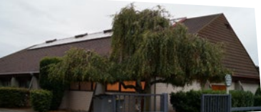
↑ Gymnase Dambach-la-Ville