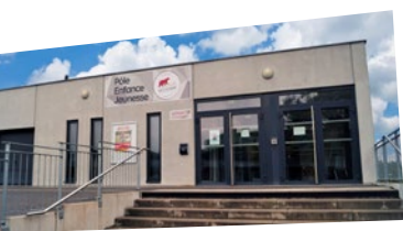
↑ Pôle Enfance Jeunesse Barr