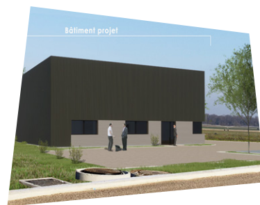
Parc d'activités du Piémont sur Goxwiller et Valff