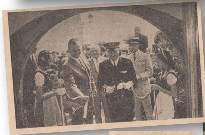
Inauguration du Foyer et du monument aux Morts le 2 août 1970

ITTERSWILLER. — Inauguration en chaîne, d'abord le monument aux morts et ici le foyer de loisirs populaires.