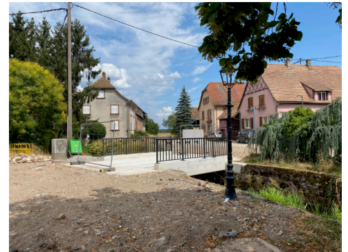
Le pont démoli, les conduites de gaz et d'électricité ont été remises en place et le tablier du pont a été reconstruit