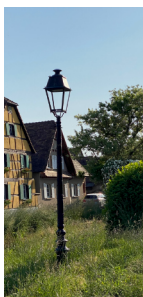
Les luminaires : nouveau et ancien