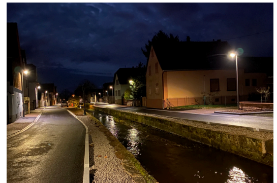
Vue actuelle de jour et de nuit