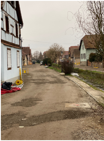
L'état de la voirie après les travaux du SDEA

Quelques chiffres : Démolition et reconstruction du pont : 138 487 € TTC Aménagement de la voirie : 813 859 € TTC Subventions : 182 809 €