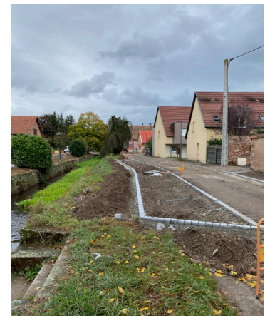
Mise en place des cheminements en pavés de granit et création des places de parking et des bordures végétales