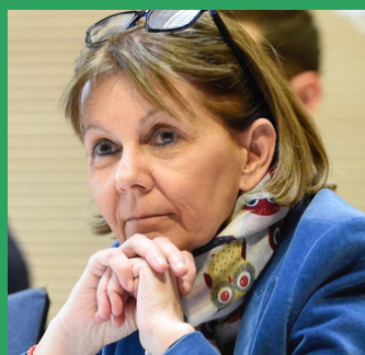
Josiane Chevalier Préfète du Bas-Rhin

Le plan de relance est activement déployé dans le département du Bas-Rhin depuis le 3 septembre 2020.