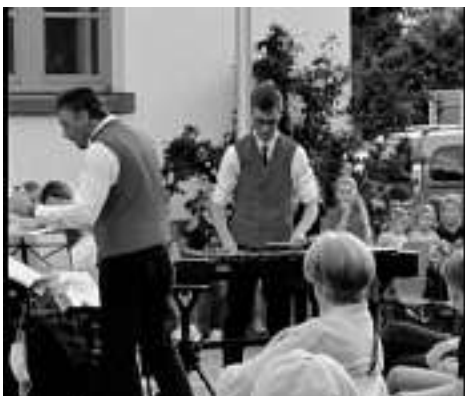
Solist Theo Lang