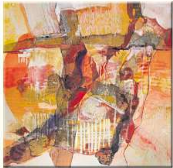
Bilder Acryl Öl Pigmente

Einladung zur Vernissage am Donnerstag 14. Oktober 2021 um 19.30 Uhr