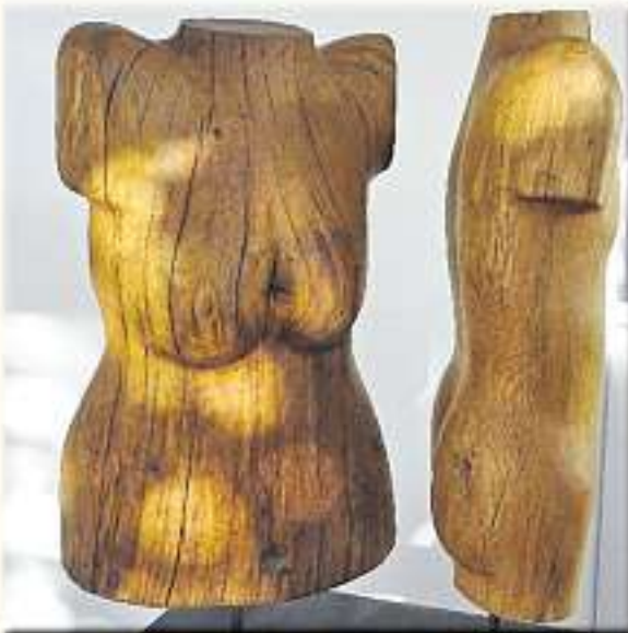
Skulpturen Holz Stein Bronze