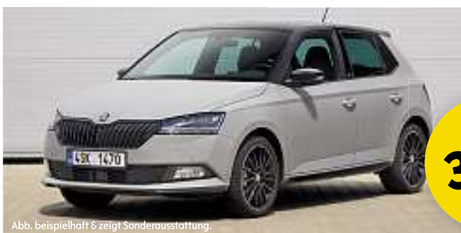
Abb. beispielhaft & zeigt Sonderausstattung.