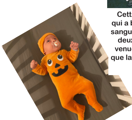
Décidément, les citrouilles auront joué de leur « mignonitude » pour nous amadouer... mais ne nous y trompons pas, Bébé KOCHER est un petit sorcier en devenir !