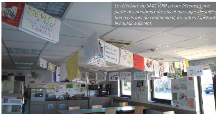
Le réfectoire du SMICTOM arbore fièrement une partie des nombreux dessins et messages de soutien reçus lors du confinement, les autres tapissant le couloir adjacent.

Gants, mouchoirs, lingettes et masques ont ainsi été retrouvés en nombre dans le bac jaune mettant directement en jeu la santé des agents de collecte et de tri. Mais l'on découvre également des encombrants, des bâches, du polystyrène, des gravats, des animaux morts... qui entravent gravement la mécanique du centre de tri. Mais au-delà de l'aspect technique, la présence d'objets autres que des emballages ou du papier est susceptible de mettre en danger la sécurité des femmes et des hommes qui finalisent votre geste de tri.