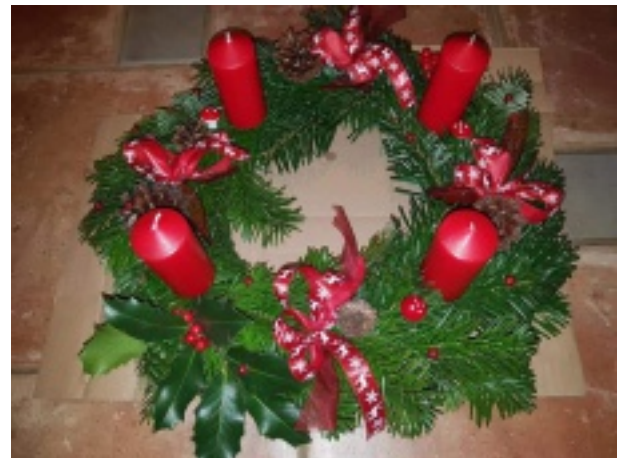
Couronne de l'Avent