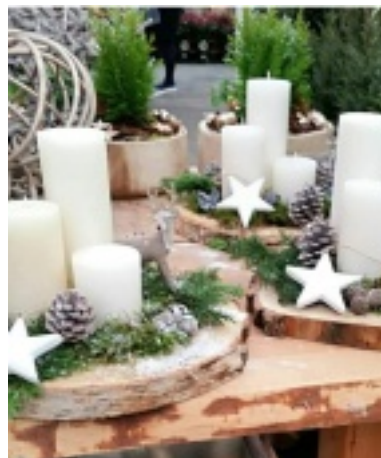
Arrangements de Table