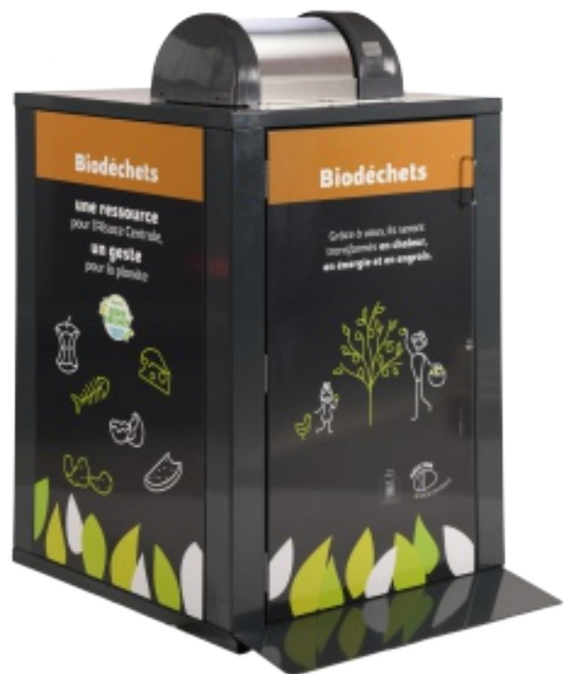
Borne de biodéchets. – Photo Smictom.

Sur la commune de Saint-Pierre, 3 bornes sont installées (rue des Acacias près du cimetière, rue de l'Eglise au dépôt de pain et au centre socio-culturel). Vous pouvez trouver leur emplacement via la carte interactive sur le site internet du SMICTOM. Depuis le démarrage du projet, plus de 220 tonnes de biodéchets ont pu être collectées et méthanisées produisant ainsi de l'énergie, de la chaleur et de l'engrais naturel.