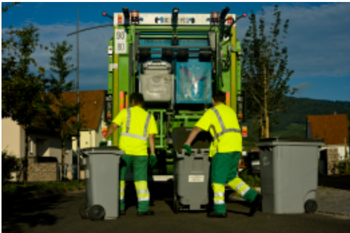
Ramassage des bacs gris.

Depuis 10 ans, en Alsace Centrale, on jette de moins en moins dans le bac gris. Avec le nouveau service des biodéchets, le SMICTOM vise une baisse supplémentaire d'environ 32kg par habitant en 2020. Ainsi, la quantité de déchets jetée dans le bac gris devrait diminuer de 30% entre 2009 et 2020.