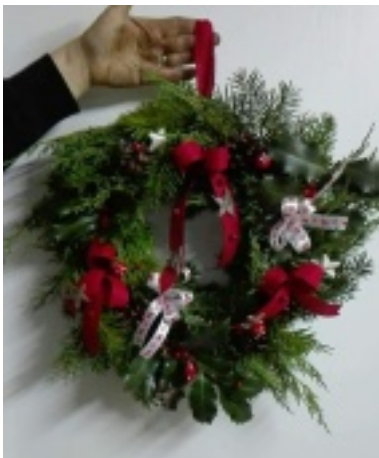
Couronne de Bienvenue