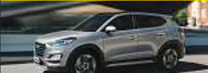
Abb. beispielhaft & zeigt Sonderausstattung.

Benzin, 130KW (177PS), 7-Gang Doppelkupplungsgetriebe, 4x4 Allradantrieb,