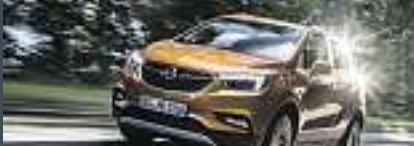
Abb. beispielhaft & zeigt Sonderausstattung.

Benzin, 103 KW (140PS), Schaltgetriebe, Frontantrieb