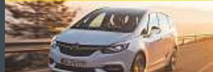
Abb. beispielhaft & zeigt Sonderausstattung.

Benzin, 125KW (170 PS), Schaltgetriebe, Frontantrieb