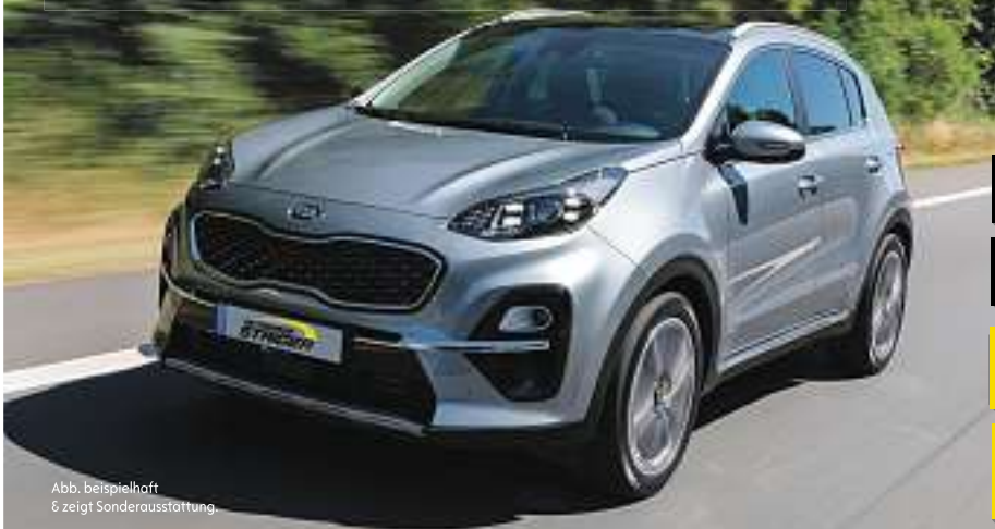
Abb. beispielhaft & zeigt Sonderausstattung.