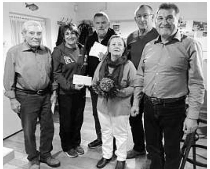
Das Foto zeigt v.l.n.r.:

Bitte vormerken: Freitag, den 28. Juni 2019 sollten sich alle Laufbegeisterten der Region fest im Kalender vormerken. Denn dann wird der nächste hoch 3 -Lauf wie gewohnt im Verbandsgebiet des Gewerbeparks rund um den Königswaldsee stattfinden. Gemeinsam mit den Vereinen haben die Verantwortlichen des Zweckverbands bereits mit den Vorbereitungen für den 15. hoch 3 -Firmenlauf 2019 begonnen.