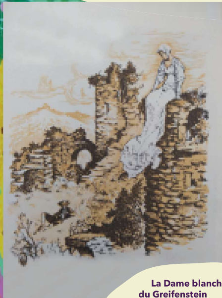
La Dame blanche du Greifenstein

Les apparitions de Dames blanches ont longtemps annoncé des morts prochaines et plus particulièrement celles d'aristocrates. Mais bien qu'elles aient cessé ces annonces funèbres, elles restent présentes comme fantômes, le plus souvent dans des châteaux, où elles sont les gardiennes d'un trésor.