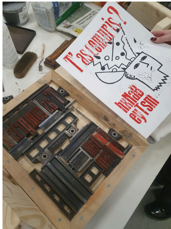
Atelier enfant découverte de la typographie