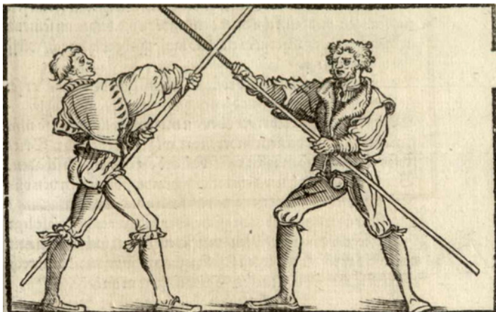
© Der Allten Fechter gründtliche Kunst. Christian Egenolff, 1535. BM Colmar