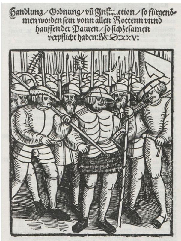
© Page de titre des 12 articles de Souabe, 1525

© © Benjamin Strickler, Éditions la nuée bleue Rencontre famille avec l'auteur Jean-Christophe Meyer