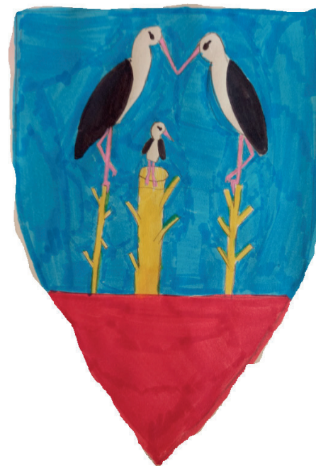
Le Blason de Stotzheim revu par les enfants de l'école élémentaire